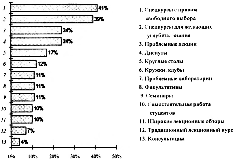
Рис. 1. Желательные формы преподавания гуманитарных и обществоведческих дисциплин

Гуманитарный курс, по мнению более половины студентов, должен быть прежде всего сориентирован на изучение современных европейских языков, на предметы этико-эстетического, психологического цикла. Примерно треть студентов выражает желание изучать такие предметы, как логика, экономика, история отечества, культурология (табл.4).