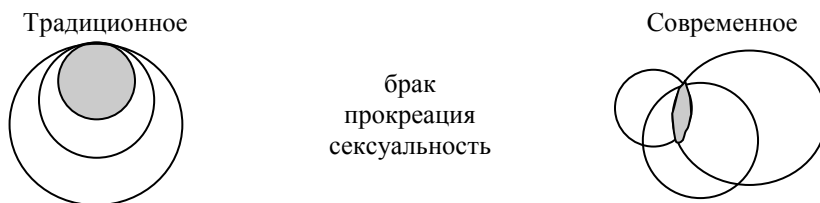
Рис. 1. Виды брачно-сексуального поведения

совпадения минимальная, когда все эти три поведения совпадают, когда вступают в брак, потом сексуальные отношения, потом рожают детей. Кажется бы традиционный – нормальный путь. Сегодня можно вступать в сексуальные отношения, не думать ни о каком браке, нелегитимных отношений достаточно. Сегодня можно вступать в брак и не рожать детей, потому что, как говорят сами брачующиеся, без детей еще лучше. Сегодня можно рожать, не вступая ни в какой брак, потому что можно родить и зарегистрировать своего ребенка. Поэтому, как правильно говорят, сегодня все равно в браке состоять или в сожительстве. Нет никакой разницы между браком и сожительством.